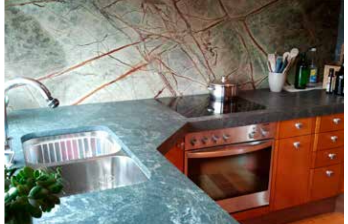
Küchenarbeitsplatte aus grünem Granit Pannonia in 3 cm Stärke und leatherstyle Oberfläche kombiniert mit 2 cm starker Rückwand Rainforest poliert