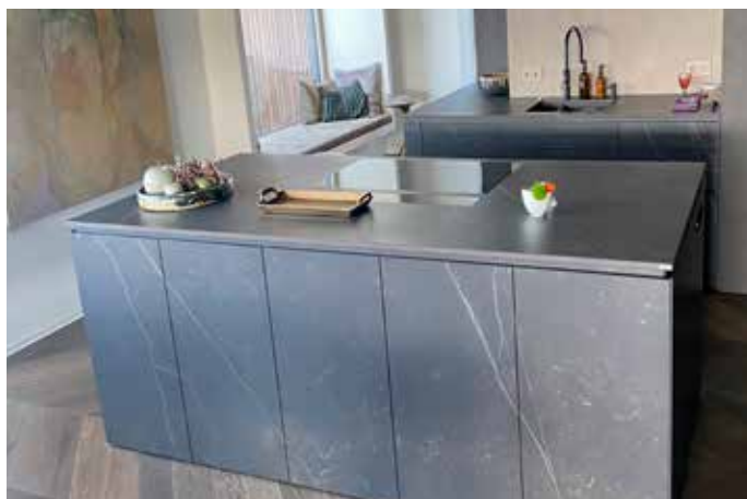
Die Küche wurde vollständig aus Dekton Kelya in 2 cm Stärke kombiniert mit 4 mm Fronten aus demselben Material strukturverlaufend verkleidet.