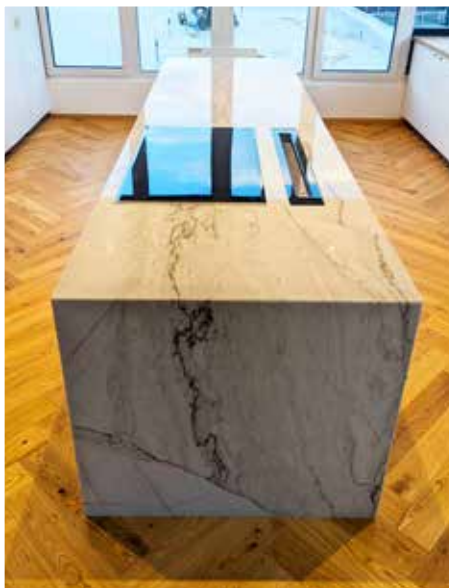
Küchenarbeitsplatte aus Quarzit Domus White, 2 cm poliert mit Seitenwange auf Gehrung strukturverlaufend montiert.