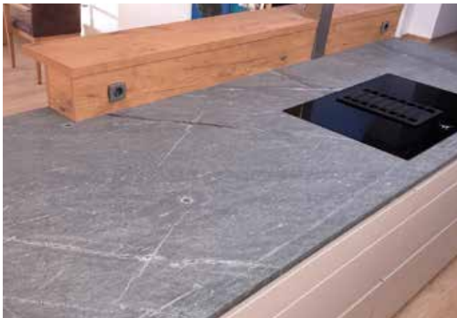
Küchenarbeitsplatte aus Sky Blue in 2 cm Stärke mit leatherstyle Oberfläche