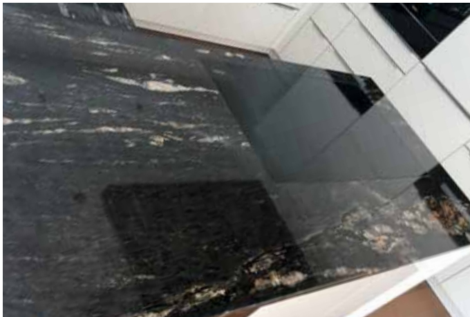
Küchenarbeitsplatte Cosmic Black in 3 cm, polierter Oberfläche und flächenbündig eingebautem Kochfeld