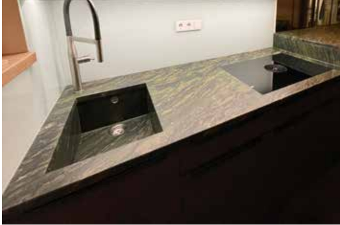
Küchenarbeitsplatte aus grünem Gabbro Picasso in 2 cm mit Unterbauspüle aus demselben Material und flächenbündig eingebautem Kochfeld. Durch die Bürstung kommt die Struktur des Steines besonders zur Geltung, durch die Steinspüle wirkt die Arbeitsplatte noch monumentaler.

Auch wenn ein Großteil der Arbeitsplatten in schwarz oder weiß gewünscht sind, setzen auch bei Arbeitsplatten bestimmte Farben immer wieder starke Trends. Seit Jahren beliebt ist die Farbe grün und seit kurzer Zeit Erdtöne sowie Kalkstein- und Travertin-Optiken, die mediterranen Flair in die Küche bringen.