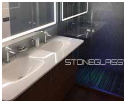
Waschtisch STONEGLASS® SNOWWHITE poliert mit Doppel Waschbecken (46,5 x 31,5 cm)

Besonders eindrucksvoll sind STONEGLASS® Waschtische mit integriertem Becken. Ob rund, oval, oder eckig, ein oder zwei Waschtische von 1 bis 2,8 Meter Länge, werden Waschtische nach Kundenwunsch massgefertigt. Durch die polierte Oberfläche des Beckens, sieht das Becken immer sauber hygienisch aus. Zur einfacheren Handhabung haben wir hier einige Standardlängen mit möglichen Ausschnittformen in verfügbaren Standardgrößen angeführt. Gerne erstellen wir für Ihre Waschtischgröße ein Angebot. Einfach Handskizze, wie u.a. senden. Bitte bei der Planung Mindeststegbreiten von mindestens 3 cm berücksichtigen. Bitte fragen Sie uns auch nach den attraktiven Objektpreisen ab 3 Stück!