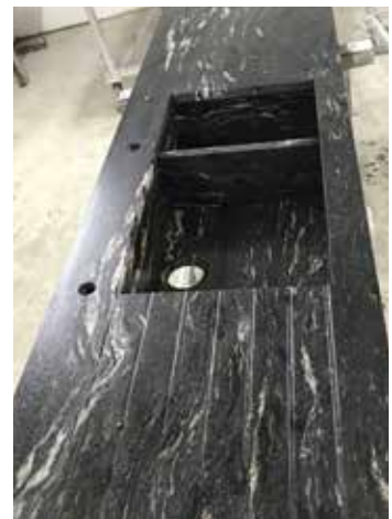
Spüle in Wunschgröße mit Abtropfrillen in einer Cosmic Black Arbeitsplatte.