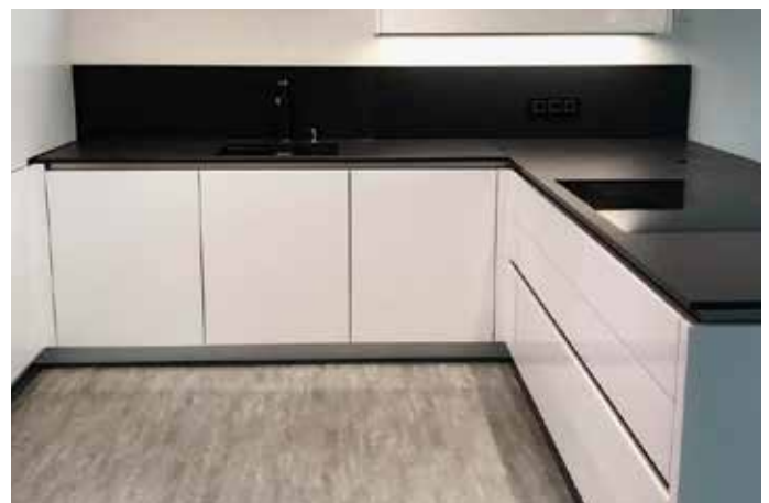
Dekton Domoos, 2 cm, mit flächenbündig eingebautem Kochfeld, Unterbauspüle und poliertem Ausschnitt sowie Rückwand aus demselben Material