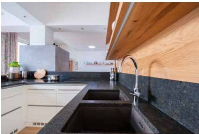
Küchenarbeitsplatte aus Granit Coffee Brown mit zwei polierten Ausschnitten für die Doppelspüle, Abtropfbrille und 18 cm hoher Wischleiste