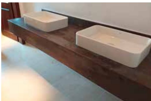
Waschtisch aus Dekton Trilium mit Gehrungsblende, Wischleiste und zwei aufgesetzten Keramikbecken