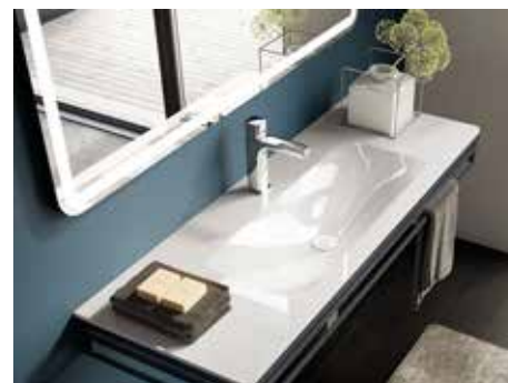
Waschtisch STONEGLASS® SNOWWHITE poliert mit rechteckigen Becken (58 x 32 cm)