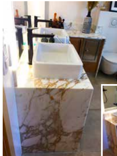
Auch bei Waschtischen klappt Premium: Waschtisch aus Marmor Calacatta Gold mit Seitenwangen strukturverlaufend und aufgesetzten Keramikbecken.