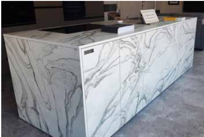
Die Küchenarbeitsplatte wurde aus Dekton Liquid Sky, 2 cm gearbeitet, die Fronten aus demselben Material, allerdings in 4mm Stärke strukturverlaufend und mit den Trägerfrontplatten verklebt.

Auf der anderen Seite der Farbskala haben weiße und marmorierte Arbeitsplatten aus Naturstein und hauptsächlich keramische Materialien eine massive Aufholjagd begonnen.