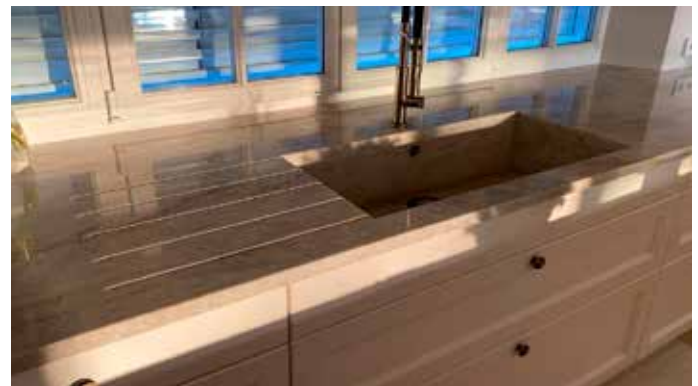
Spüle in Wunschgröße aus Taj Mahal, 3 cm poliert, auf Gehrung gefertigt und in die Arbeitsplatte integriert. Praktische Ergänzung: Abtropfrillen.