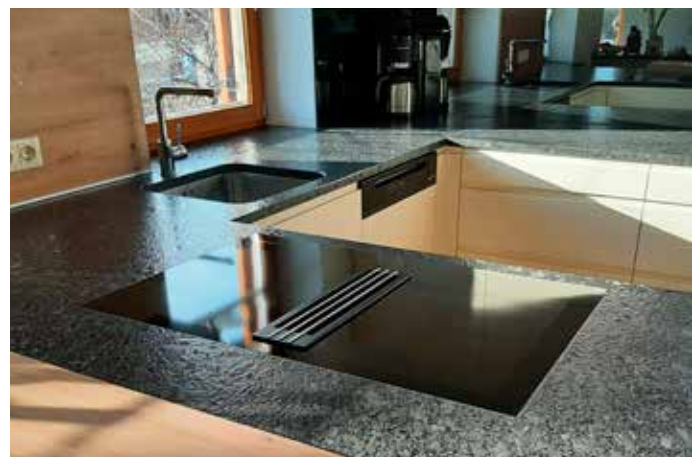
Küchenarbeitsplatte aus Granit Steel Grey mit leatherstyle Oberfläche in 2 cm, Unterbauspüle und flächenbündig eingebautem Kochfeld