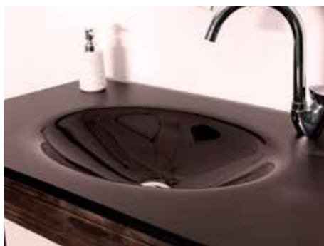
Waschtisch STONEGLASS® DEEPBLACK poliert mit ovalem Becken (45 x 33 cm)