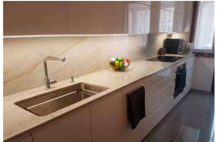
Küchenarbeitsplatte und Rückwand aus Quarzit Sky Gold, 2 cm poliert mit großer Unterbauspüle und flächenbündig eingebautem Kochfeld