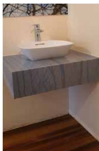
Noch ein Premium-Waschtisch: Der blauweiße Quarzit Azul Macauba, strukturverlaufend produziert, mit aufgesetztem Keramikbecken verleiht dem Badezimmer ein edles und mediterranes Flair.