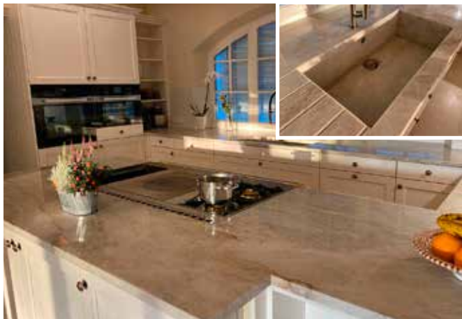
Küchenarbeitsplatte aus Quarzit Taj Mahal in 3 cm Stärke und polierter Oberfläche, flächenbündig eingebautem Gaskochfeld und Spüle auf Gehung in Wunschgröße sowie Abtropfrillen.

#highendsolutions Besonders stolz sind wir, wenn wir Küchen vollständig mit Naturstein oder Keramik veredeln dürfen. Funktion und Design in Perfektion - aus einer Küche wird ein Highend-Statement - und trotzdem praktisch und unempfindlich im täglichen Gebrauch.