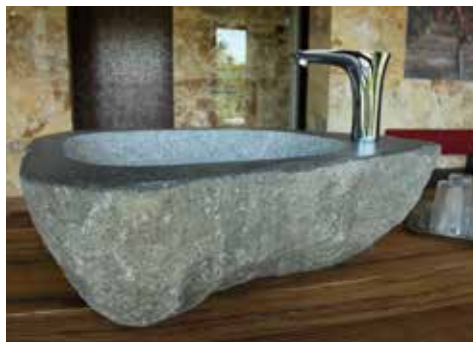
Freistehendes Waschbecken aus einem „Findling“, mit eingefrästem Spülenbecken und aufgesetzter Armatur