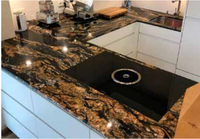
Küchenarbeitsplatte aus Granit Cosmic Fusion mit polierter Oberfläche in 2 cm Stärke und flächenbündig eingebautem Kochfeld von Bora

Wir meinen, die Arbeitsplatte aus Stein oder Keramik ist die Krönung jeder Küche. Deshalb lieben wir unseren Beruf. Wir veredeln mit unseren Arbeitsplatten aus Naturstein, Quartz oder Keramik und einer unglaublich großen Vielfalt an Farben, Strukturen und Mustern, jede Küche und machen aus ihr ein wunderschönes höchstpersönliches Statement aus Form, Funktion und Design.