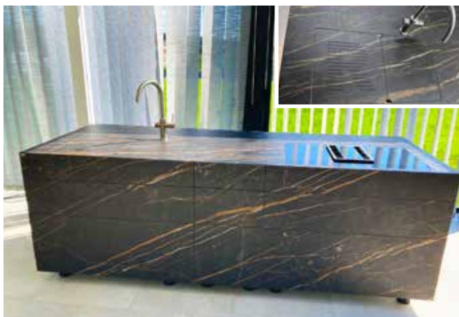
Kücheninsel vollständig strukturverlaufend mit Keramik Noir Desir und auf Gehung verkleidet. Auch die Spülenabdeckung wurde in das Konzept integriert und kann als Untersetzer bzw. Gemüsebrett genutzt werden.