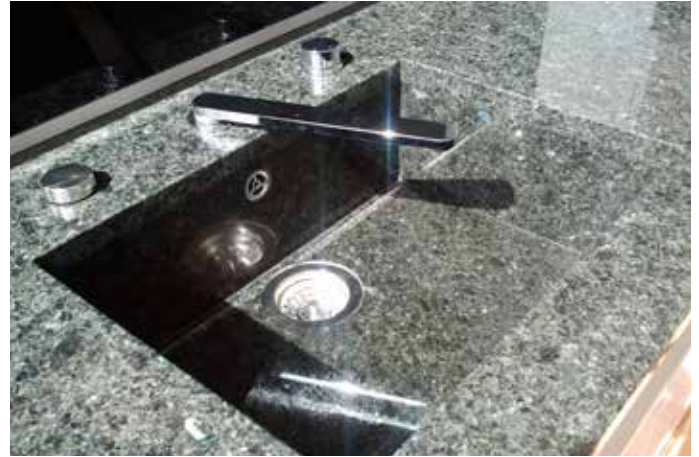
Spüle in Wunschgröße für die Outddorküche aus 3 cm Labrador Blue und polierter Oberfläche. Die Armatur ist versenkbar, um die Küche im Winter zudecken zu können.