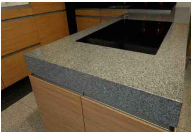
Küchenarbeitsplatte aus dem österreichischen Granit Herschenberger in polierter Oberfläche und 8 cm hoher Gehrungsblende