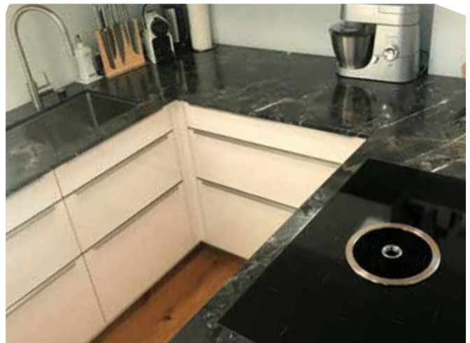
Küchenarbeitsplatte aus Quarzit Infinity brown in 2 cm Stärke und polierter Oberfläche, Unterbauspüle und flächenbündig eingebautem Kochfeld