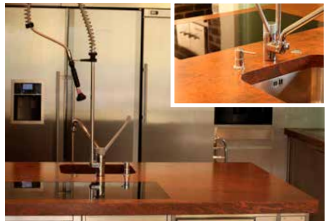
Küchenarbeitsplatte aus Granit Multicolor, 3 cm poliert, mit flächenbündig eingebautem Kochfeld, Unterbauspüle und Seifenspender