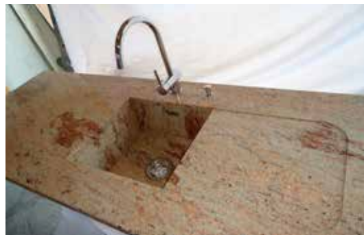
Steinspüle aus Ivory Brown integriert in die Arbeitsplatte und um eine vertieft abgesetzte Tropfasse ergänzt.