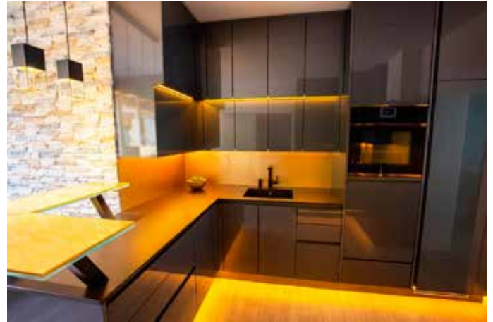
Dekton Sirius, 2 cm; flächenbündig eingebautes Kochfeld und poliertem Ausschnitt für Unterbauspüle sowie Rückwand in 8 mm Stärke aus demselben Material