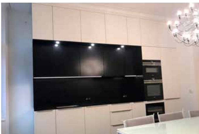
Küchenarbeitsplatte, Rückwand und Fronten aus Nero Assoluto in 12 mm mit leatherstyle Oberfläche.