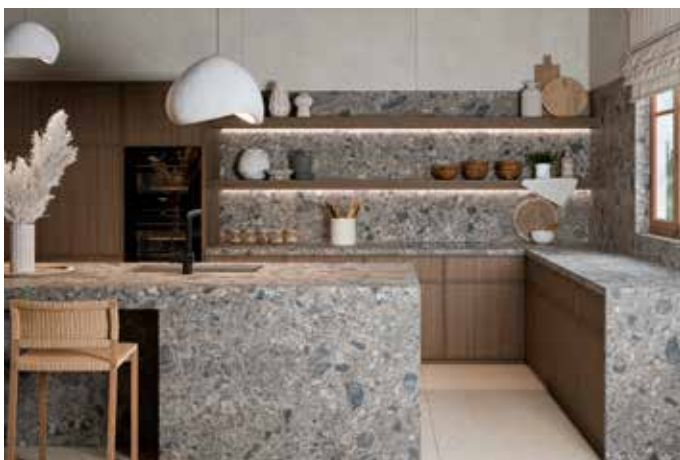
Küchenarbeitsplatte, Seitenwangen und Rückwände auf Gehrung aus Dekton Ceppo in 2 cm Stärke