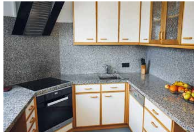
Küchenarbeitsplatte aus Granit Rosa Beta in 3 cm Stärke und polierter Oberfläche