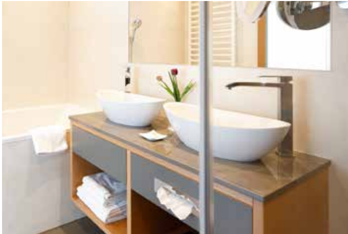
Für dieses Hotel wurde eine Kleinserie der Waschtischplatte aus Dekton Korso XGLOSS in 2 cm produziert. Mit den aufgesetzten Becken wirkt der Waschtisch insgesamt romantisch.

Neben Steinspülen produzieren wir auch eine große Anzahl an Waschtischen (ergänzt mit handelsüblichen Keramikspülen) aus Naturstein, Quarzkomposit und Keramik. Diese Waschtische sind pflegeleicht, „peppen“ jedes Badezimmer auf und sind preisgünstig. Sie benötigen mehr als 3 Waschtische? Bitte fragen Sie nach unseren attraktiven Objektpreisen: office@stein.at - 03184 / 24 08.