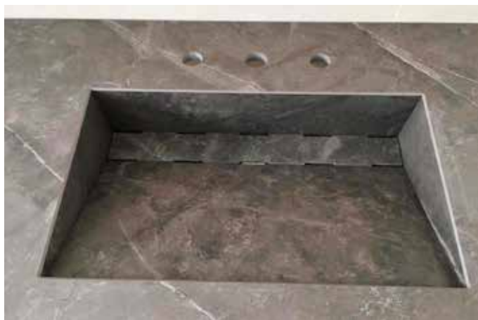
Waschtisch aus Dekton Kira 2 cm. Das Becken wurde vollständig auf Gehrung gearbeitet und in den Waschtisch integriert. Das Inlay kann einfach herausgenommen werden, um den Abfluss zu reinigen.