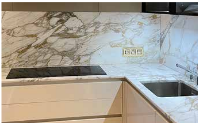
Küchenarbeitsplatte und Rückwand aus Marmor Calacatta Gold in 2 cm poliert, Unterbauspüle sowie flächenbündigem Kochfeld. Durch die Beleuchtung wirkt das Material noch „güldener“