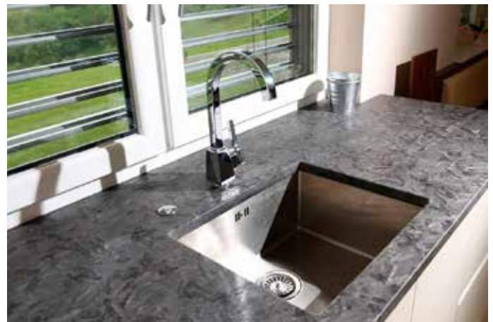
Küchenarbeitsplatte aus Granit Matrix mit poliertem Ausschnitt für Unterbaubecken