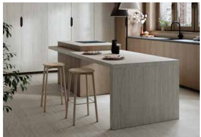
Küchenarbeitsplatte mit Seitenwange aus Dekton Marmorio in 1,2 cm Stärke