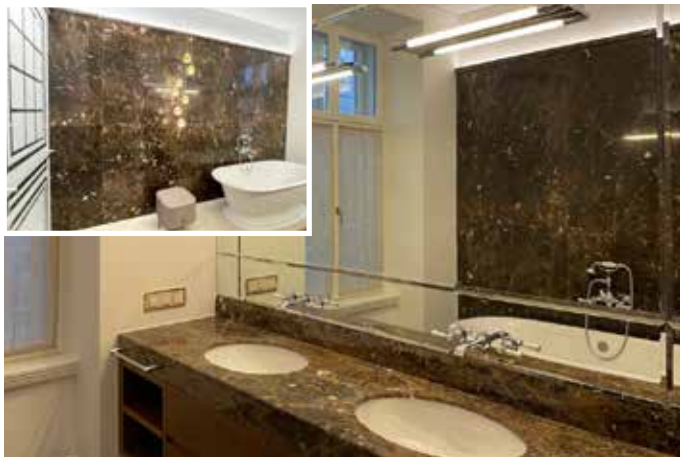
Waschtisch aus Marmor „Emperador“ mit weißen Unterbau- becken, poliertem Ausschnitt und Gehrungsblende. Unterhalb des Spiegels wurde eine Blende mit Facettenschliff montiert, damit der Spiegel und der Stein einen stufenlosen Übergang bilden. Im Übrigen wurde eine Wand nach dem Vermessen des Raumes mit proportional gleich großen Platten Emperador verkleidet.