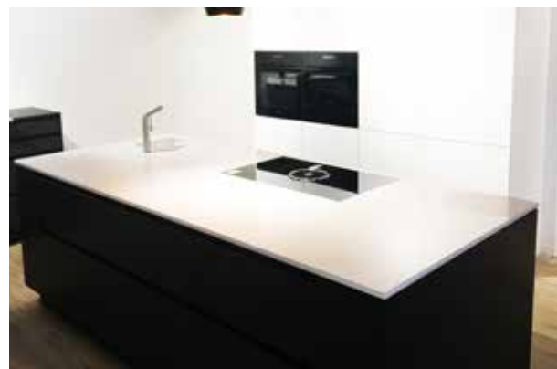
Küchenarbeitsplatte aus Silestone Blanco Zeus, 2 cm poliert mit Unterbauspüle und flächenbündig eingebautem Kochfeld.