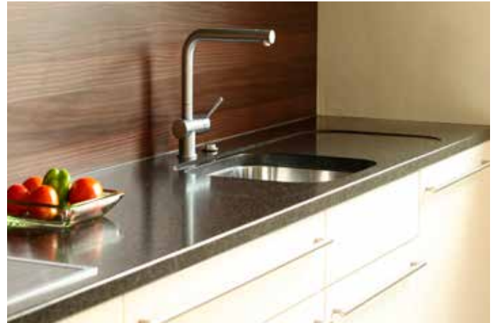
Küchenarbeitsplatte aus Granit Impala in 3 cm und polierter Oberfläche, Unterbauspüle und abgesetzter Tropftrasse