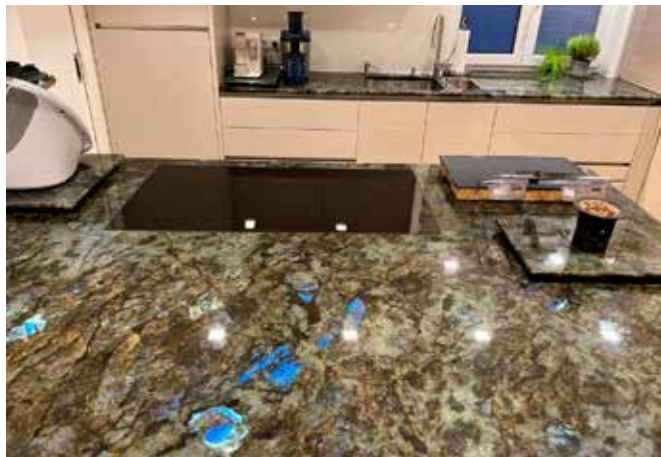
Küchenarbeitsplatte aus Quarzit Labrador Madagaskar in 3 cm Stärke und polierter Oberfläche, rechts im Bild ein Untersetzer für den Esstisch aus demselben Material