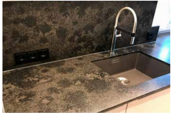
Küchenarbeitsplatte aus Granit Mystic Grey, 2 cm leatherstyle und Rückwand aus demselben Material