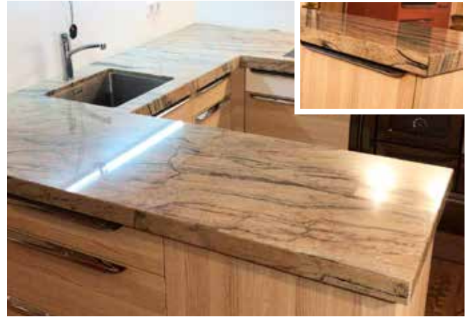
Küchenarbeitsplatte aus Gneis Pasha Gold mit 5 cm hoher Gehrungsblende (Materialstärke 2 cm)