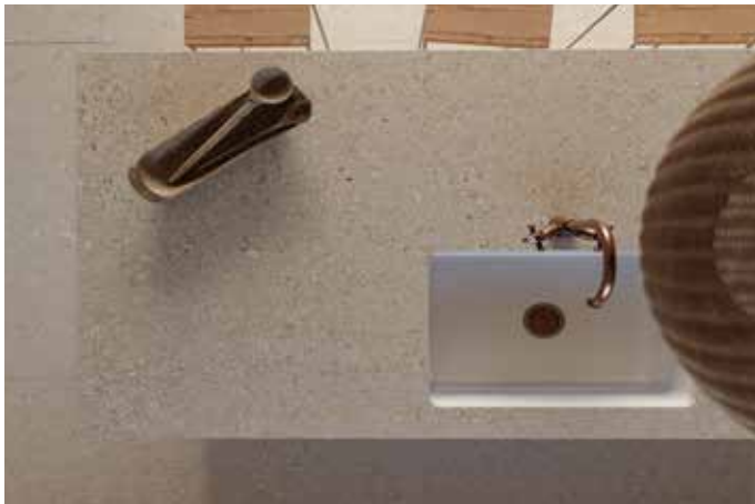
Küchenarbeitsplatte aus Dekton Avorio in 2 cm Stärke und strukturierter Oberfläche mit eingebaute Unterbauspüle