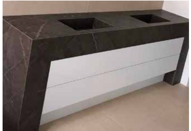
Waschtisch mit Doppelwaschbecken aus Dekton Kira, 2 cm. Sowohl die Front- und Seitenblenden als auch die Waschbecken wurden auf Gehrung gefertigt. Dadurch erzielt dieser Waschtisch sein massives Aussehen.