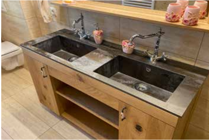
Waschtisch mit Doppelwaschbecken aus 12 mm Dekton Trilium. In Kombination mit dem Eichenmöbel wirkt die Komposition rustikal und modern zugleich.

Um ihrer Küche oder Ihrem Badezimmerwaschtisch das Sahnehäubchen aufzusetzen, wählen viele unserer Kunden die Option, die Spüle (bzw. das Becken) auch aus demselben Material von uns produzieren zu lassen. Durch die vielen Verarbeitungsmöglichkeiten und der Möglichkeit (fast) jede Wunschgröße fertigen zu können, entsteht bei diesen Arbeiten immer ein wunderbares individuelles Einzelstück.