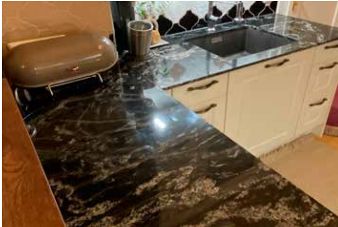
Küchenarbeitsplatte aus Granit Scorpion Black, 2 cm stark und polierter Oberfläche

#dunklezeichnung Vielen ist eine durchgehend schwarze Küchenarbeitsplatte aber „too much“ bzw. wünschen sich Küchenbesitzer auch etwas „Leben“ in ihrer Arbeitsplatte. Auch dafür bieten wir ein umfangreiches Repertoire an Arbeitsplatten aus Naturstein und Keramik an.