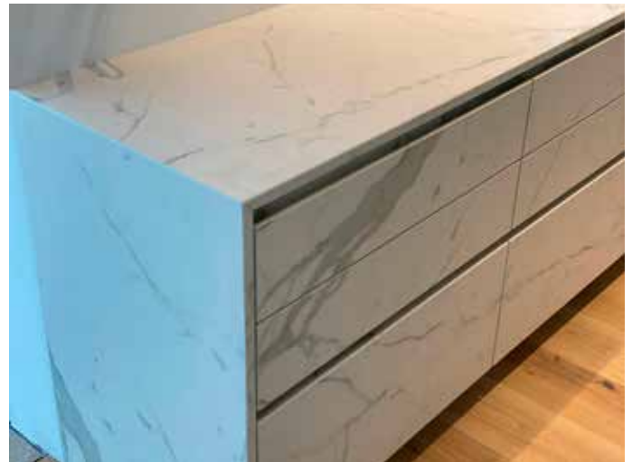
Die Arbeitsplatte, Fronten wurden aus Keramik "Calacatta" in 12 mm Stärke, strukturverlaufend verarbeitet.