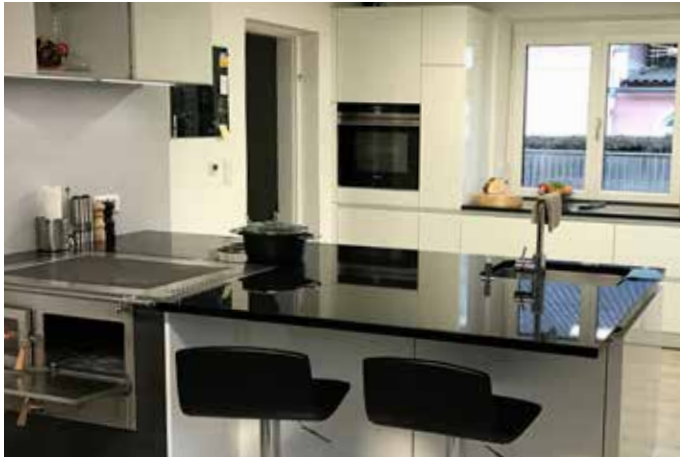
Küchenarbeitsplatte Nero Assoluto, 3 cm poliert, kombiniert mit Holzofen

Rund 75 % unserer Arbeitsplatten sind schwarz bzw. dunkel gehalten. Der Grund ist einfach: Harmonisiert mit so ziemlich allem und verleiht jeder Küche Eleganz und ist sowohl als Naturstein als auch Keramik pflegeleicht.