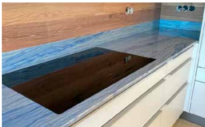
Küchenarbeitsplatte aus Quarzit Azul Macauba, 2 cm poliert, mit 10 cm hoher Wischleiste, flächenbündig eingebautem Kochfeld und Unterbauspüle